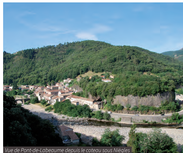
Vue de Pont-de-Labeaume depuis le coteau sous Niègles

C'est l'objet d'une des facettes des études préalables lancées par la communauté de communes et principalement le sujet de cette note d'information.